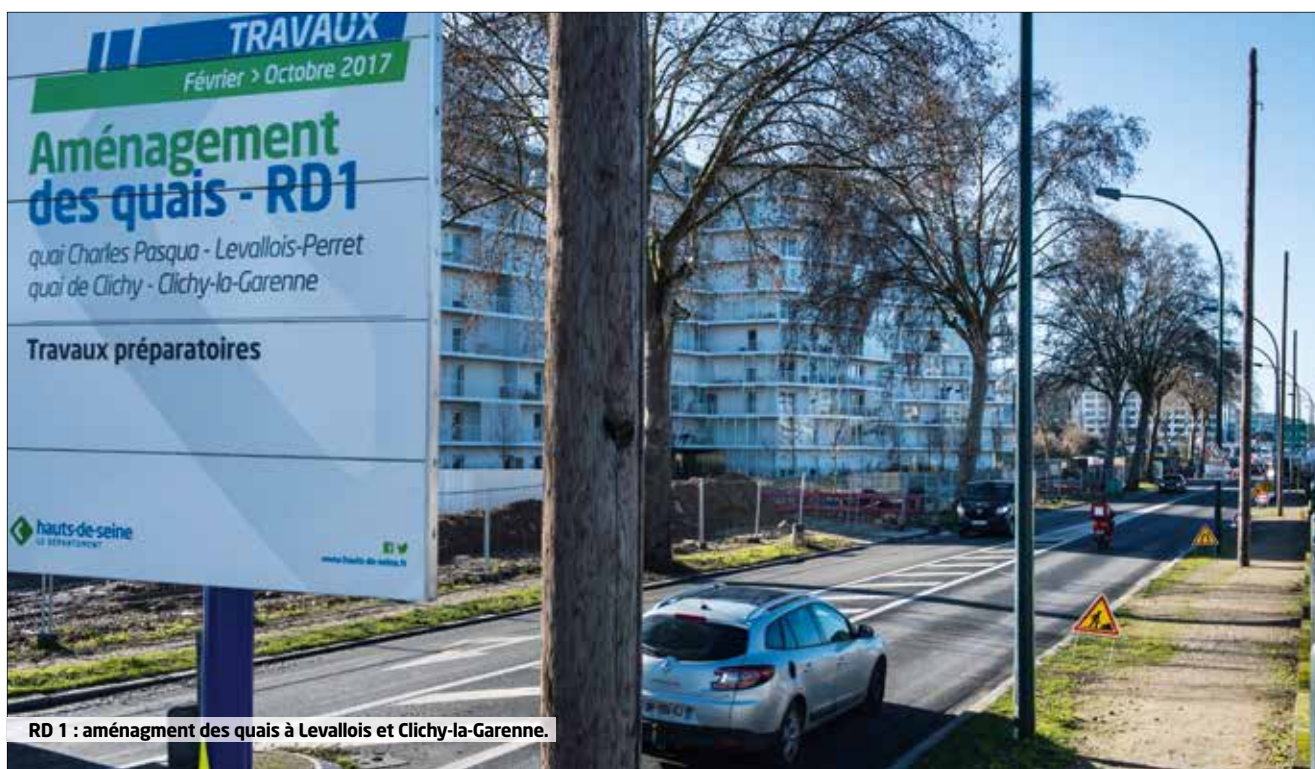
RD 1 : aménagement des quais à Levallois et Clichy-la-Garenne.

RD 180 : rue de la Porte Jaune au carrefour avec la rue de Buzenval. Réaménagement du carrefour et des espaces verts. Les travaux débutent en octobre 2017 pour une durée de six mois.