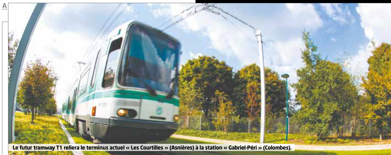
Le futur tramway T1 reliera le terminus actuel « Les Courtilles » (Asnières) à la station « Gabriel-Péri » (Colombes).