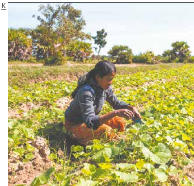
K - Cambodge : de nombreux producteurs ont démarré une production maraîchère et diversifiée avec l'appui des équipes du Gret et d'Agrisud International.

Depuis 2009, 349 projets Initiatives Jeunes Solidaires ont été financés à hauteur de 960 000 €.