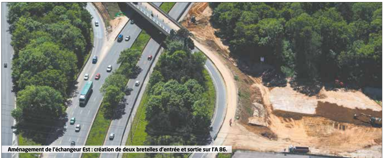
Aménagement de l'échangeur Est : création de deux bretelles d'entrée et sortie sur l'A 86.

Domaine départemental de Sceaux : renouvellement du mail de la plaine de Châtenay.