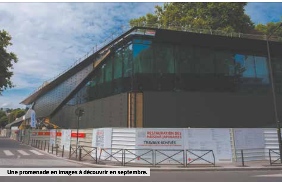
Une promenade en images à découvrir en septembre.