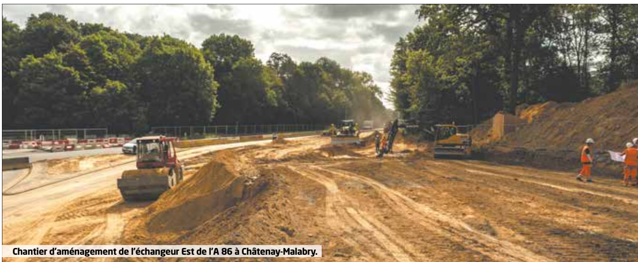
Chantier d'aménagement de l'échangeur Est de l'A 86 à Châtenay-Malabry.

de septembre sur la voirie et dans les parcs départementaux