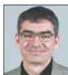
Pierre Ouzoulias Groupe Front de Gauche et Citoyens (PCF-GC)

Dès la rentrée, le conseil départemental lance Pass+, un dispositif renforcé et multiservices destiné à tous les collégiens des Hauts-de-Seine. L'aide financière a été revalorisée à 80 € pour des activités culturelles ou sportives. Ce montant s'élève à 85 € pour les élèves boursiers. Dématérialisé, ce dispositif s'articulera avec l'Environnement Numérique des Collèges et fédèrera l'ensemble de l'offre éducative du Département envers les collégiens ; nous ne pouvons que nous en réjouir.