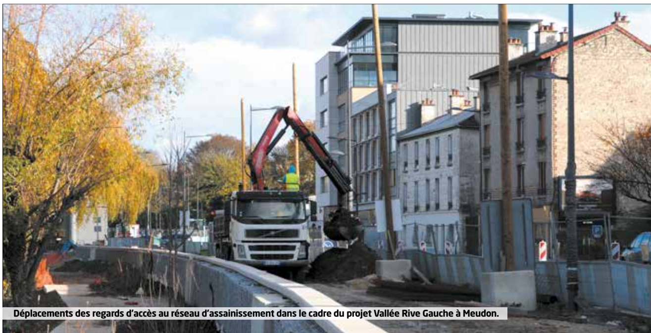
Déplacements des regards d'accès au réseau d'assainissement dans le cadre du projet Vallée Rive Gauche à Meudon.

de décembre sur la voirie et dans les parcs départementaux