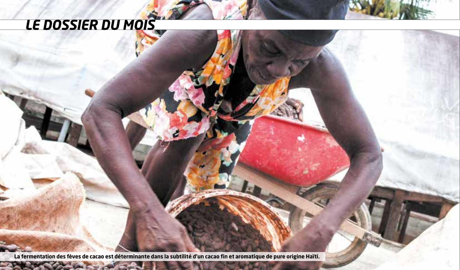
La fermentation des fèves de cacao est déterminante dans la subtilité d'un cacao fin et aromatique de pure origine Haïti.