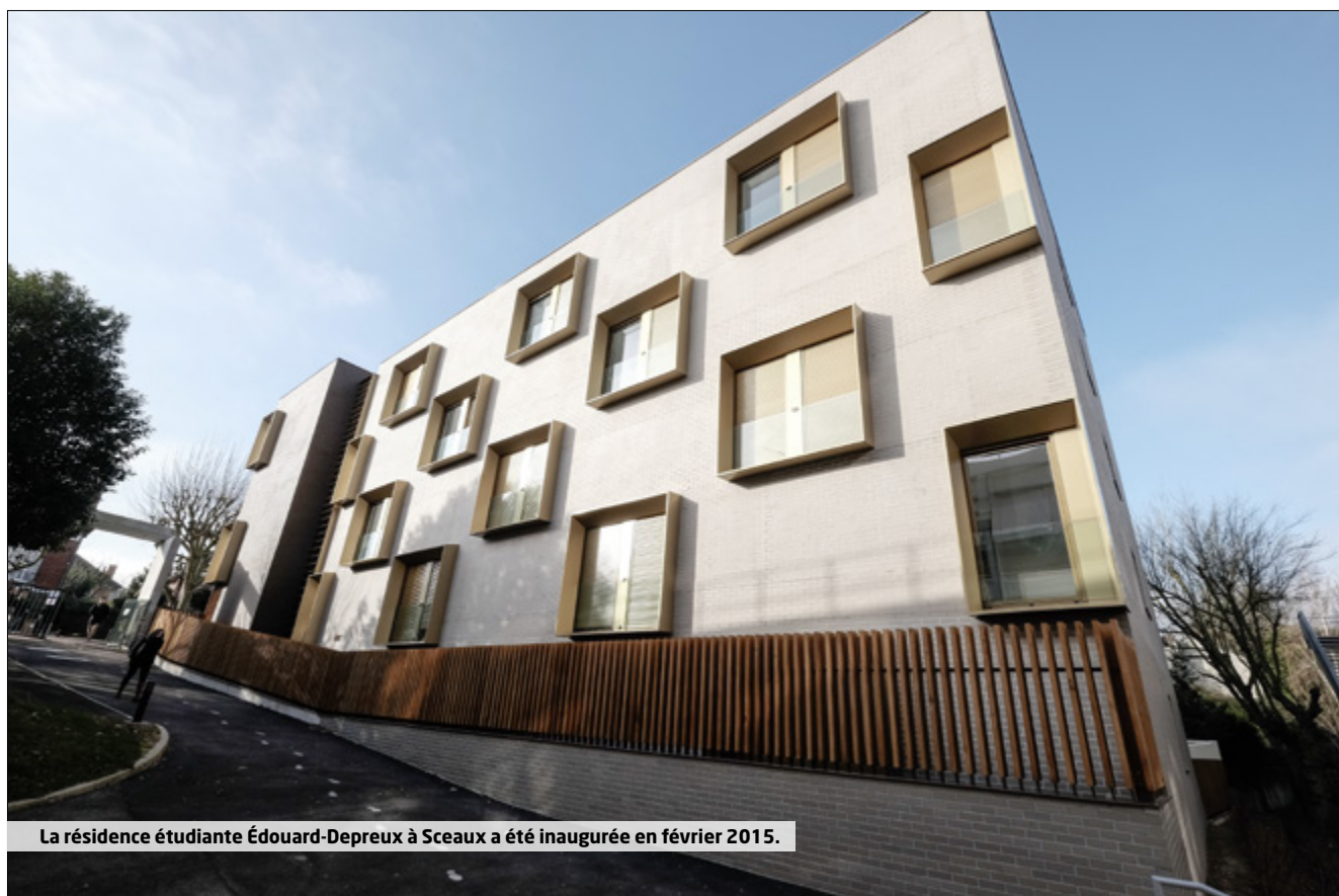
La résidence étudiante Édouard-Depreux à Sceaux a été inaugurée en février 2015.

Au regard du bilan intermédiaire à ce jour, toutes les conditions sont donc réunies pour que l'objectif de 4 200 logements, fixé par la convention, soit atteint d'ici à 2019. Au rythme actuel de la recherche d'opportunités foncières, le bilan pourra être porté de 3 811 logements à 4 200 logements dans le délai prévu par la convention.