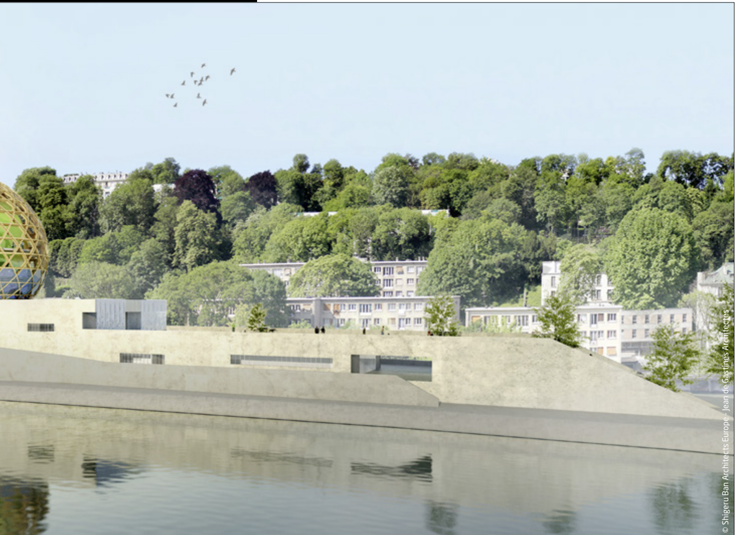
© Shigeru Ban Architects Europe - Jean de Castines Architectes