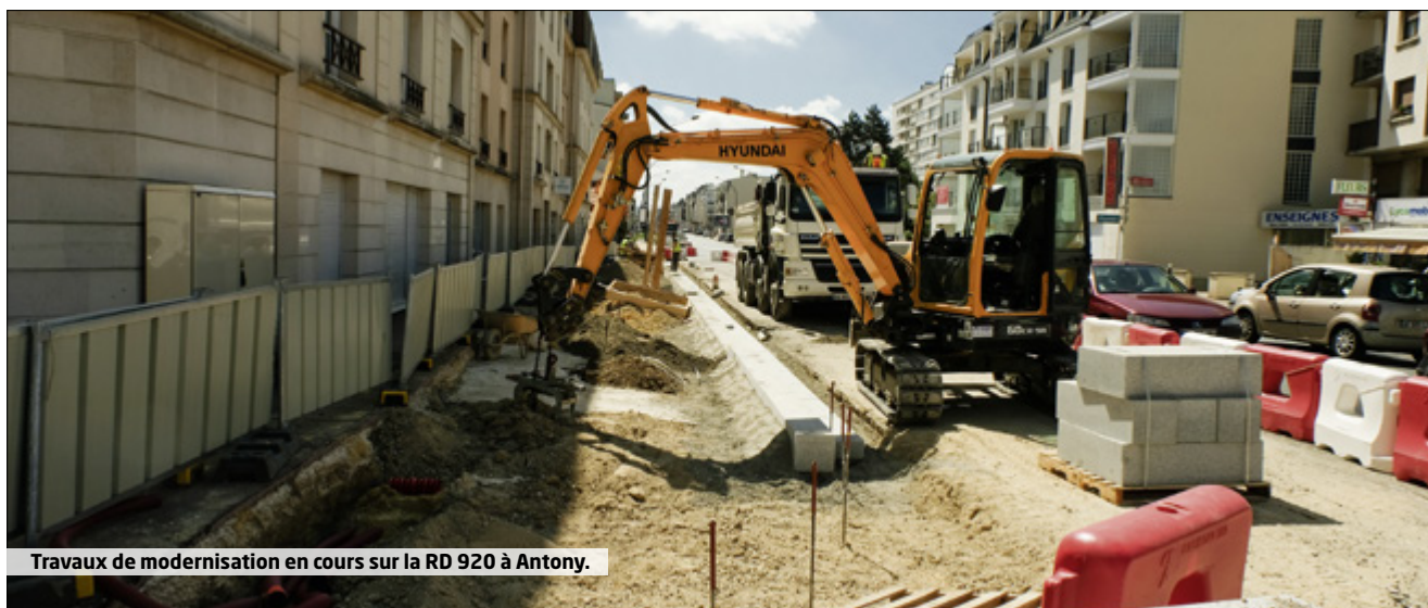
Travaux de modernisation en cours sur la RD 920 à Antony.

RD 407 : rue de Marnes et rue de Sèvres, entre l'avenue Thierry et l'avenue Gambetta. Requalification et de sécurisation de la voie départementale. Les travaux ont débuté en janvier pour une durée prévisionnelle de dix-huit mois.