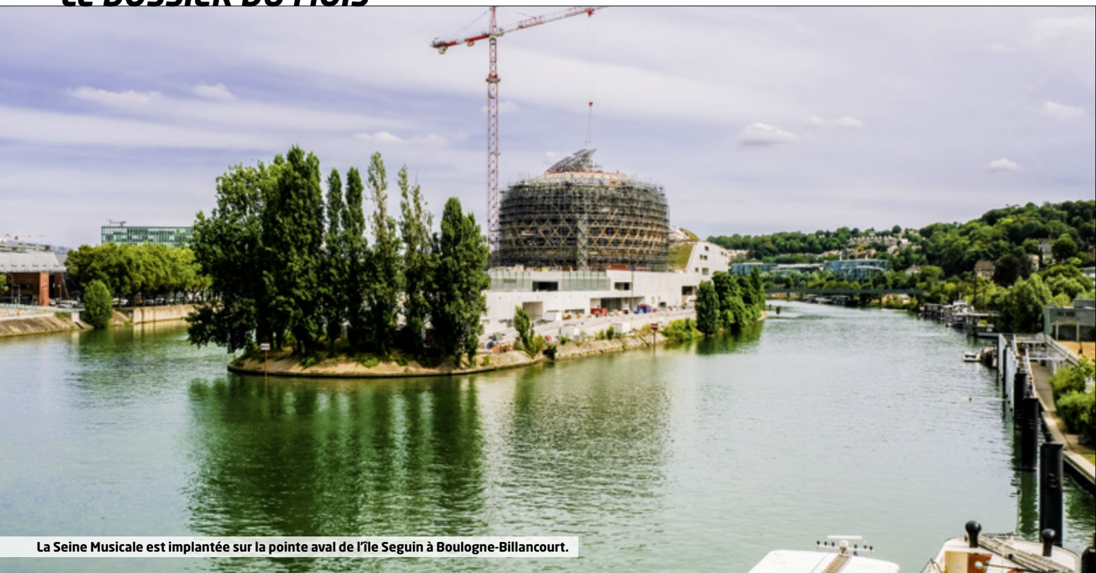
La Seine Musicale est implantée sur la pointe aval de l'île Seguin à Boulogne-Billancourt.