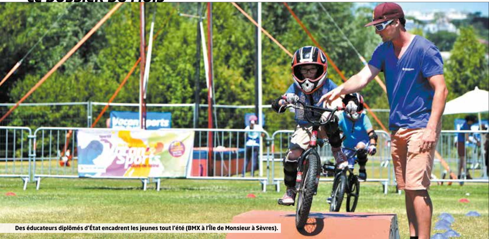
Des éducateurs diplômés d'État encadrent les jeunes tout l'été (BMX à l'Île de Monsieur à Sèvres).