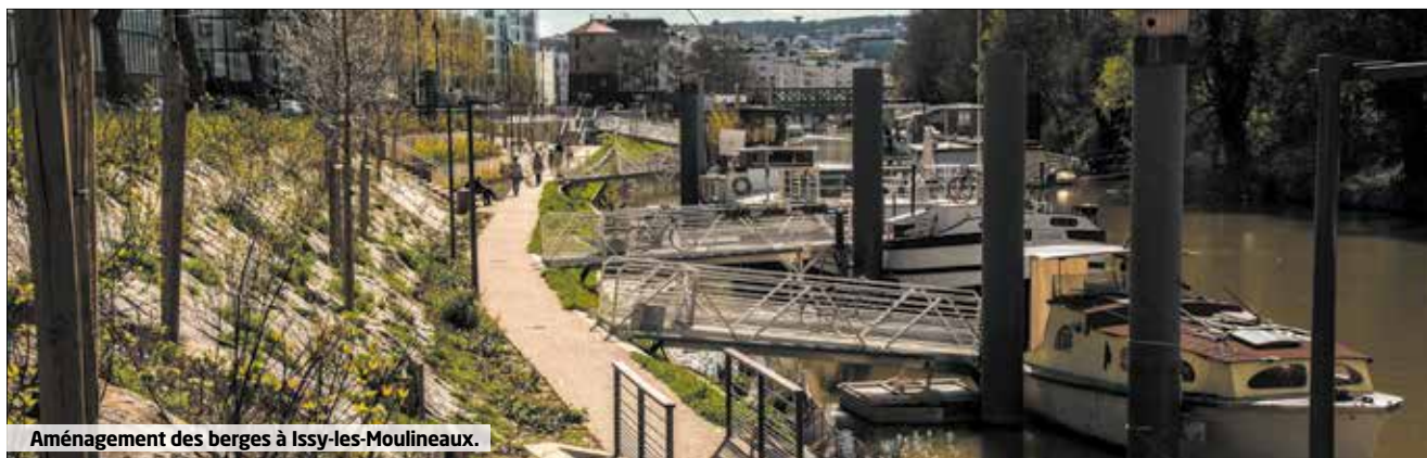
Aménagement des berges à Issy-les-Moulineaux.

de juillet et août sur la voirie et dans les parcs départementaux