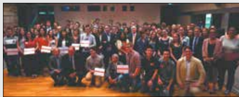
Remise des diplômes aux 45 lauréats de l'appel à projets IJS 2014, le 16 juin dernier à l'hôtel du Département à Nanterre.

Au Gourma-Rharous, les aides ont permis la prise en charge d'enfants en malnutrition, l'accès à l'eau potable et la mise en place d'un périmètre irrigué de 35 ha, afin de contribuer à une diversification alimentaire. À Dioula, le second programme a appuyé la production d'un miel de qualité pour une meilleure valorisation des produits apicoles de la région en assurant des revenus aux habitants du Banico.