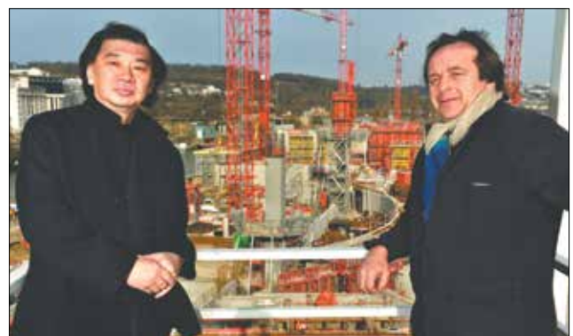
Les deux architectes : Shigeru Ban et Jean de Gastines

cite-musicale-ile-seguin.hauts-de-seine.net