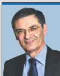
Patrick Devedjian Président Antony