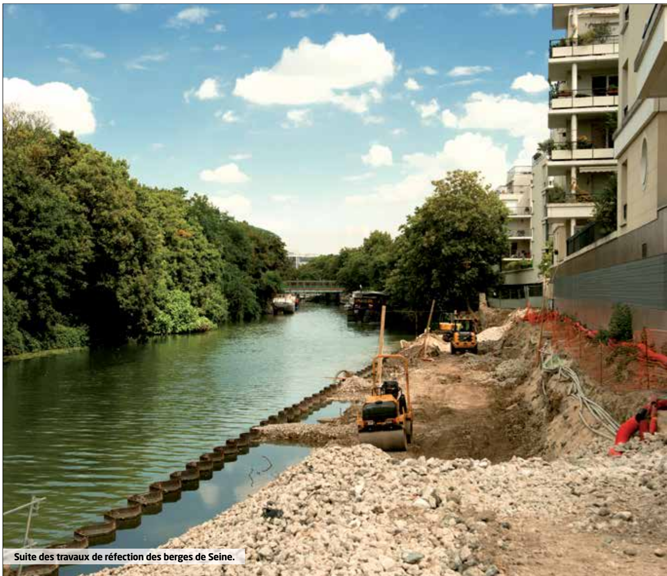
Suite des travaux de réfection des berges de Seine.

du mois de mars sur la voirie et dans les parcs départementaux