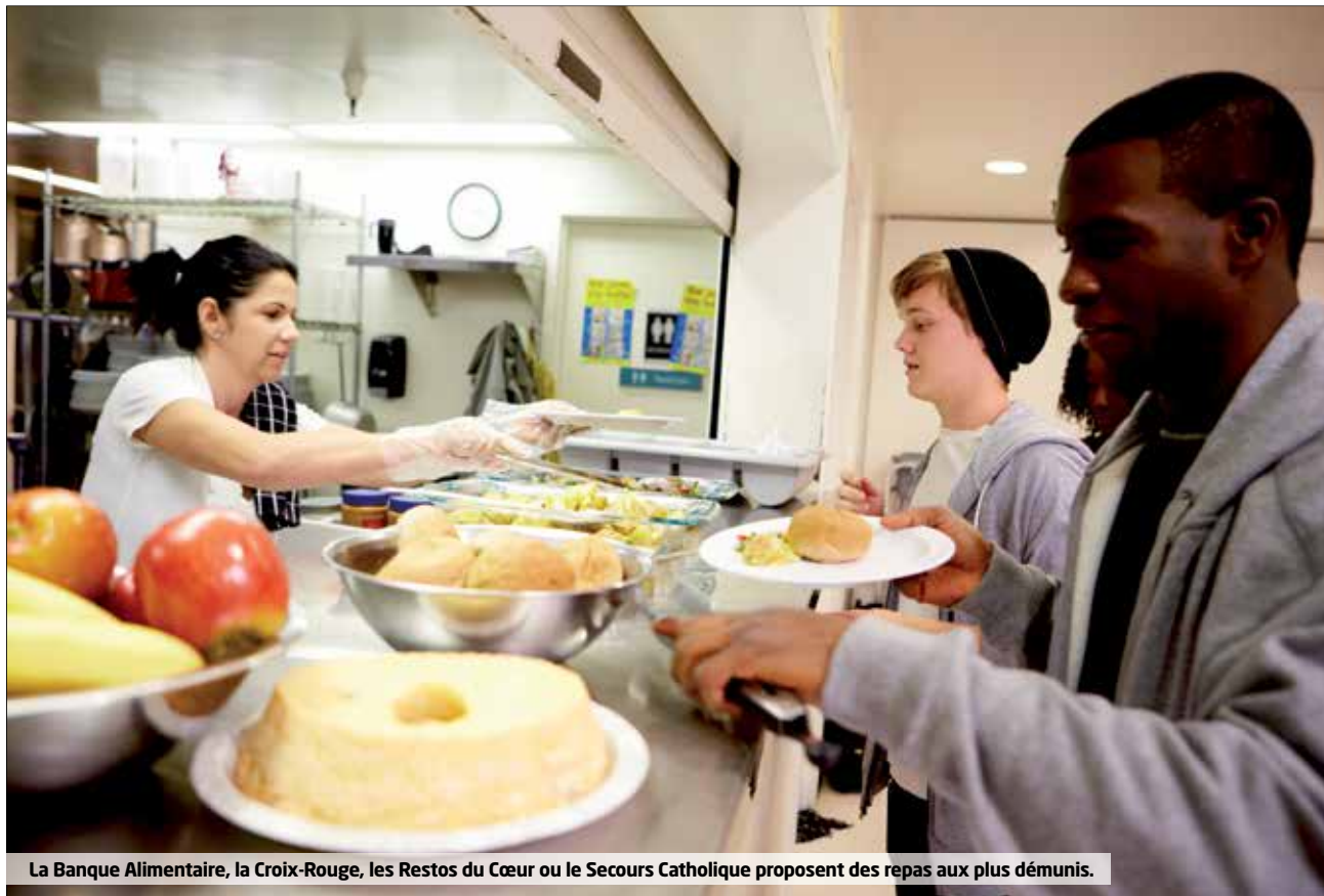
La Banque Alimentaire, la Croix-Rouge, les Restos du Cœur ou le Secours Catholique proposent des repas aux plus démunis.

L'Institut des Hauts-de-Seine renouvelle son opération Sourire de Noël avec le soutien du Département.