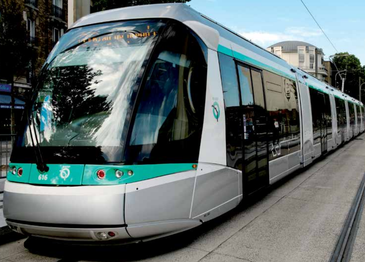
Le tramway relie Châtillon à Viroflay en quarante minutes.