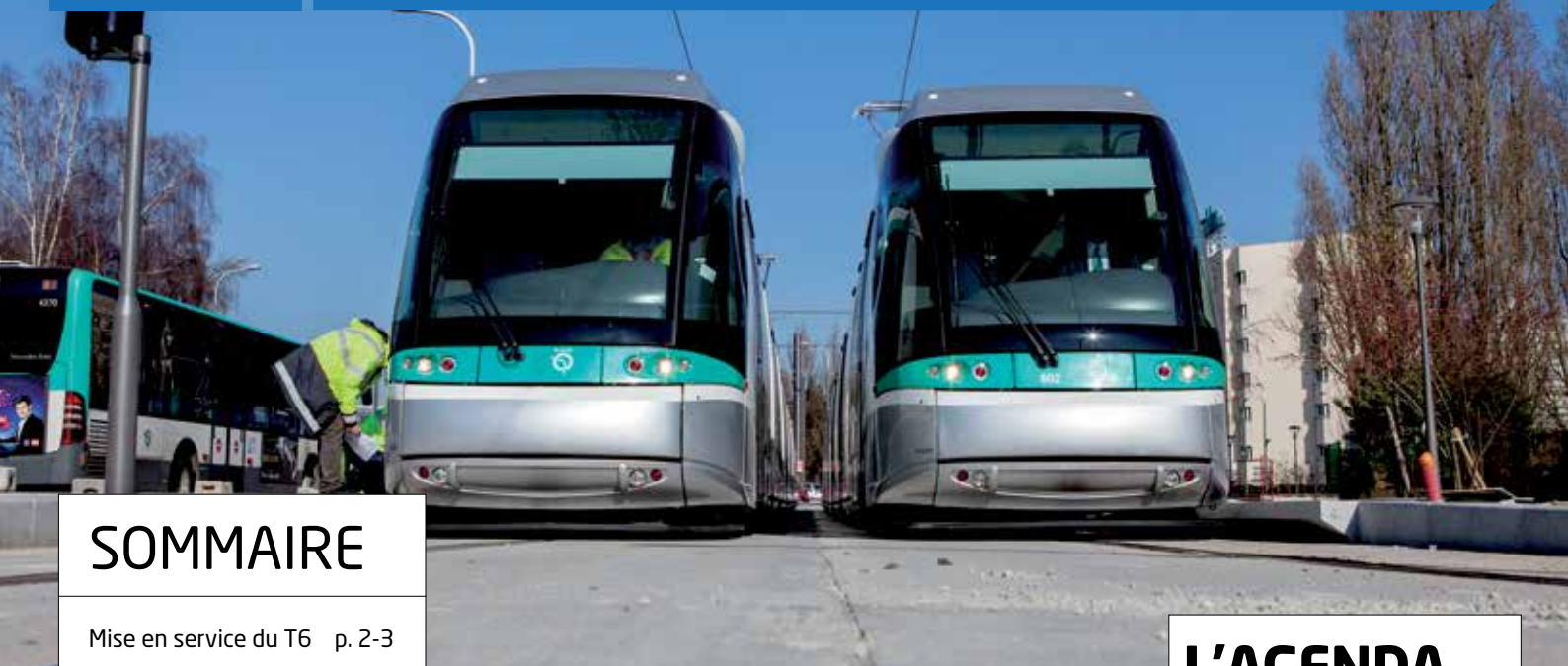
Le T6 est en service depuis le 13 décembre entre Châtillon et Vélizy.