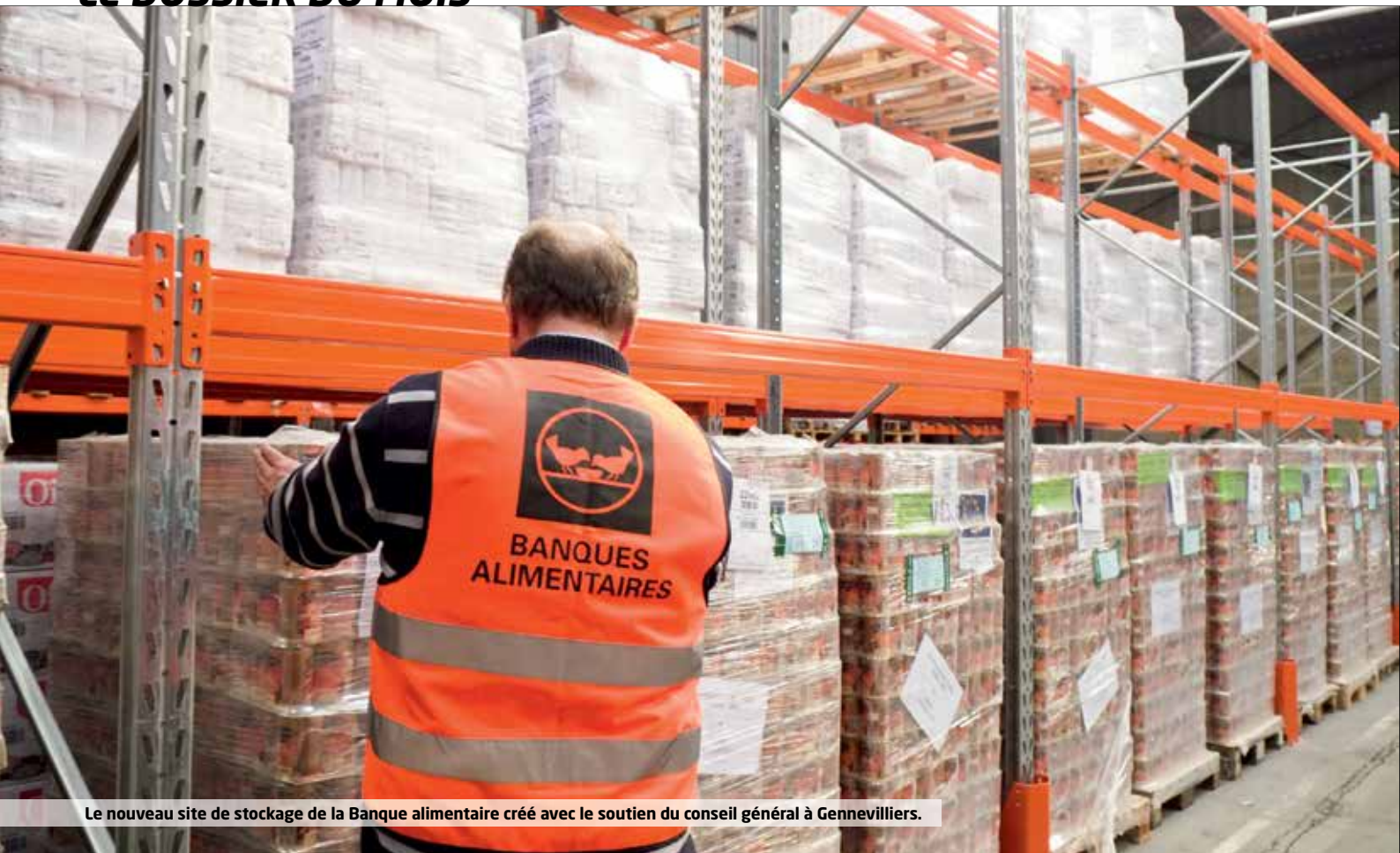
Le nouveau site de stockage de la Banque alimentaire créé avec le soutien du conseil général à Gennevilliers.