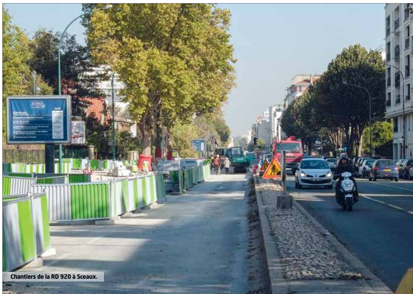
Chantiers de la RD 920 à Sceaux.

Domaine national et parc du Pré Saint-Jean. Réhabilitation de regards d'accès au collecteur du ru de Vaucresson. Emprises des travaux localisées au niveau des regards, à l'avancement jusqu'en décembre.