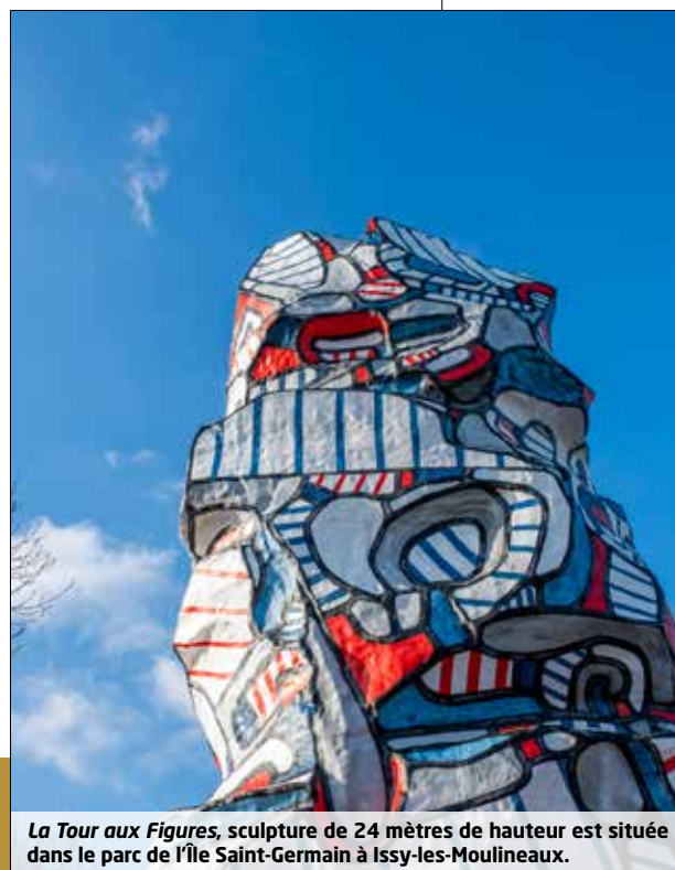
La Tour aux Figures, sculpture de 24 mètres de hauteur est située dans le parc de l'Île Saint-Germain à Issy-les-Moulineaux.

7 712 800 de visiteurs dans les musées et sites culturels et patrimoniaux du territoire (incluant les parcs des Domaines départementaux)