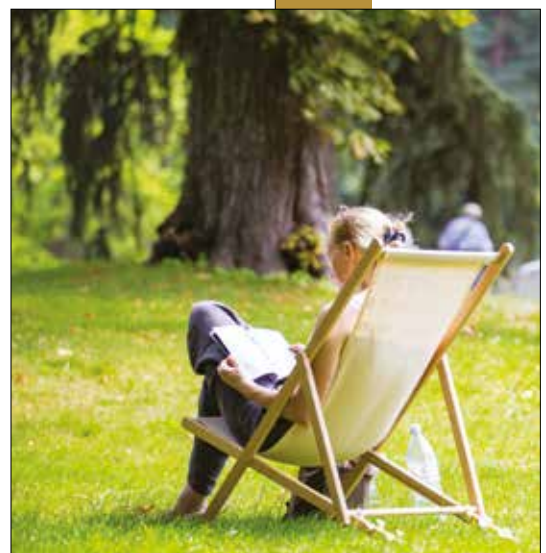
Un été à lire du 8 juillet au 27 août au domaine départemental de la Vallée-aux-Loups