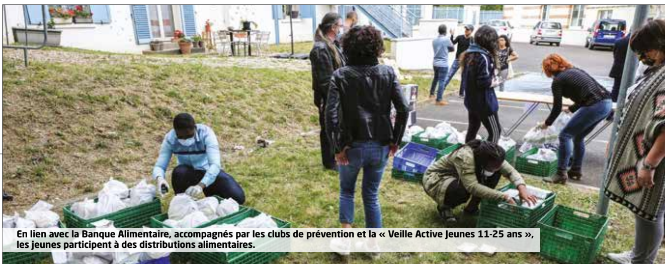
En lien avec la Banque Alimentaire, accompagnés par les clubs de prévention et la « Veille Active Jeunes 11-25 ans », les jeunes participent à des distributions alimentaires.

alimentaires, à une formation aux métiers de la vente et de la distribution bio en partenariat avec une coopérative spécialisée dans la distribution alimentaire, ou même à un atelier cycle, pour réviser ou réparer des vélos pour eux ou les habitants, accompagné de randonnées pour découvrir le territoire.