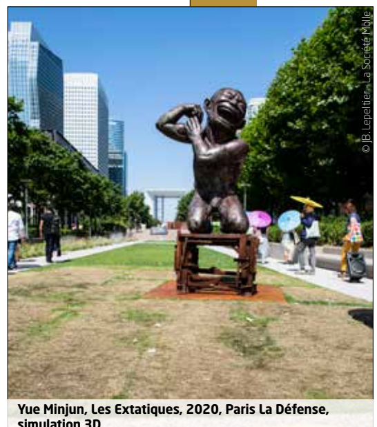
Vue Minjun, Les Extatiques, 2020, Paris La Défense, simulation 3D