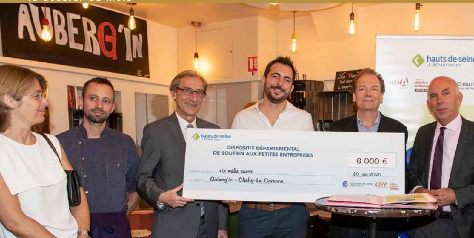
Le restaurant Auberg'in à Clichy fait partie des premiers bénéficiaires des aides départementales aux petites entreprises. Un chèque de 6 000 euros a été remis à son gérant le 30 juin.