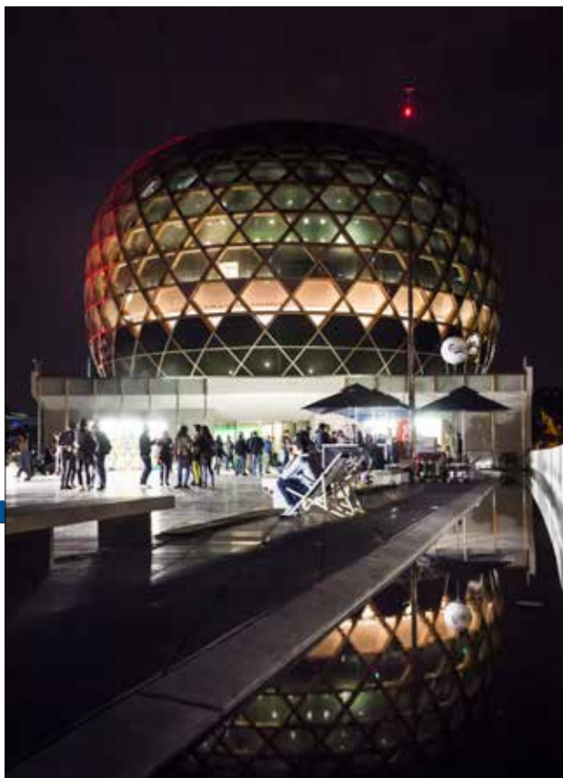
La Seine Musicale sur l'Île Seguin à Boulogne-Billancourt

le dispositif comme les Opéras en plein air et le Grand Feu de Saint-Cloud, une sélection de concerts à la Seine Musicale à Boulogne-Billancourt sera proposée dès la rentrée.