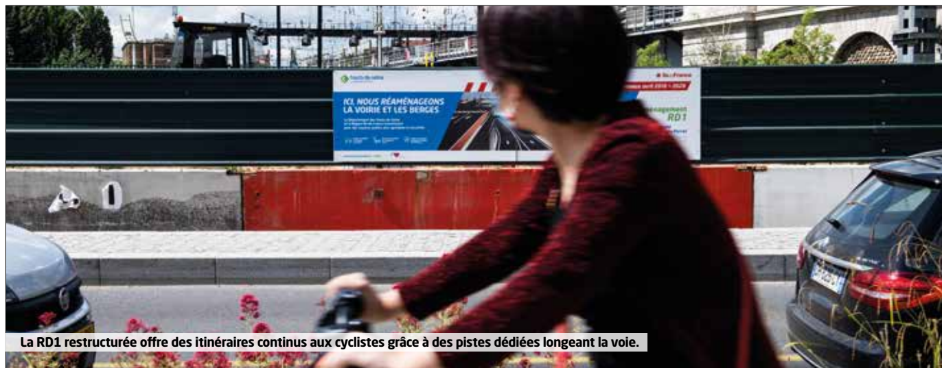
La RD1 restructurée offre des itinéraires continus aux cyclistes grâce à des pistes dédiées longeant la voie.

Plus de renseignements sur www.hauts-de-seine.fr/mon-departement/les-hauts-de-seine/les-grands-projets/la-promenade-des-jardins