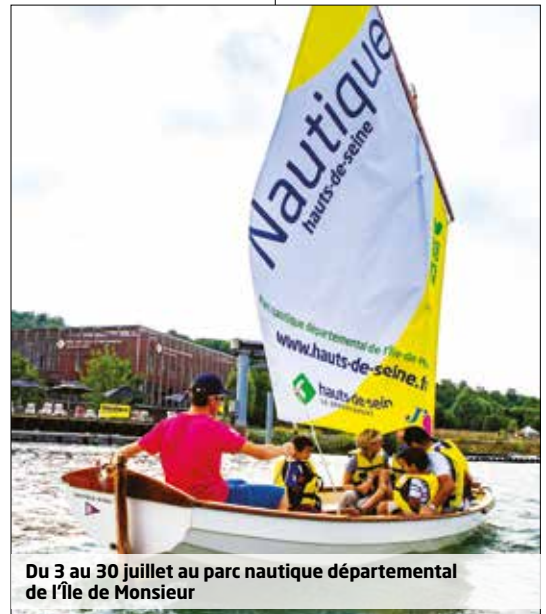
Du 3 au 30 juillet au parc nautique départemental de l'île de Monsieur

Trois cent étudiants qui ont souffert du confinement et cent cinquante Jeunes travailleurs issus des Foyers de Jeunes travailleurs pourront ainsi partir. Le Département remettra à chacun d'entre eux la somme de vingt-cinq euros pour participer à leurs dépenses pendant la journée.