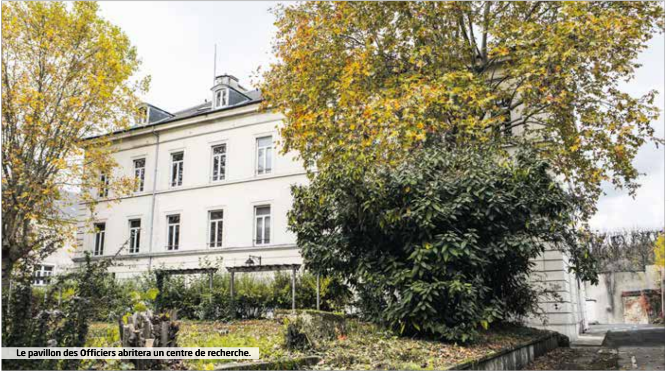
Le pavillon des Officiers abritera un centre de recherche.