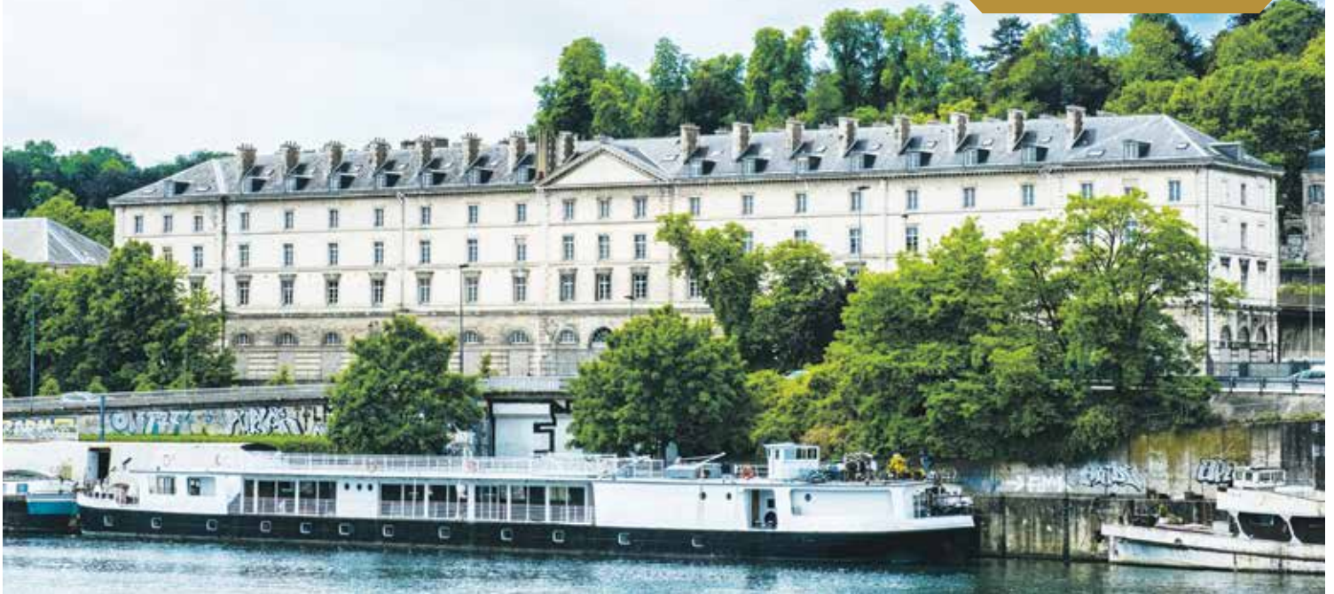
La caserne Sully à Saint-Cloud accueillera le Musée du Grand Siècle (lire notre dossier p.2).