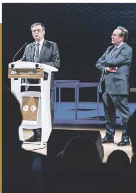
Patrick Devedjian et Pierre Bédier, lors de la cérémonie des vœux 2020 à La Seine Musicale.

À l'occasion d'une cérémonie de vœux commune dans l'auditorium de La Seine Musicale, à Boulogne, Patrick Devedjian et Pierre Bédier ont annoncé l'ouverture d'une « séquence de concertation et de participation citoyenne ».