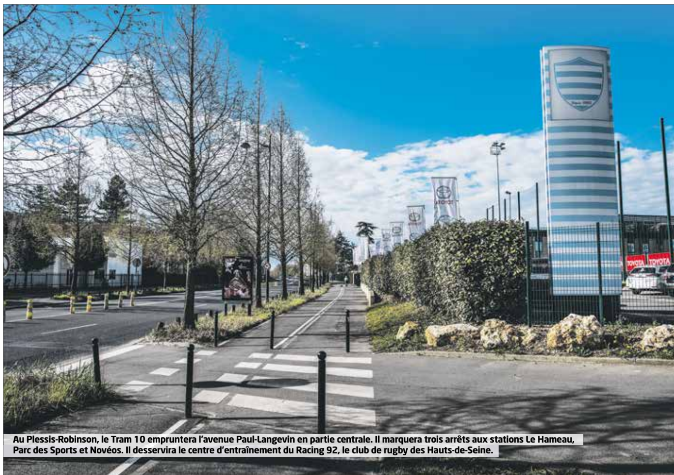
Au Plessis-Robinson, le Tram 10 empruntera l'avenue Paul-Langevin en partie centrale. Il marquera trois arrêts aux stations Le Hameau, Parc des Sports et Novéos. Il desservira le centre d'entraînement du Racing 92, le club de rugby des Hauts-de-Seine.

RD 914 - boulevard de La Défense et rue Félix-Eboué, entre le boulevard Circulaire et la rue Célestin-Hébert. Requalification urbaine du boulevard. Début des travaux en janvier 2019 pour une durée prévisionnelle de 36 mois. Plus de renseignements sur www.hauts-de-seine.fr/mon-departement/les-hauts-de-seine/les-grands-projets/la-voirie-departementale/rd-914