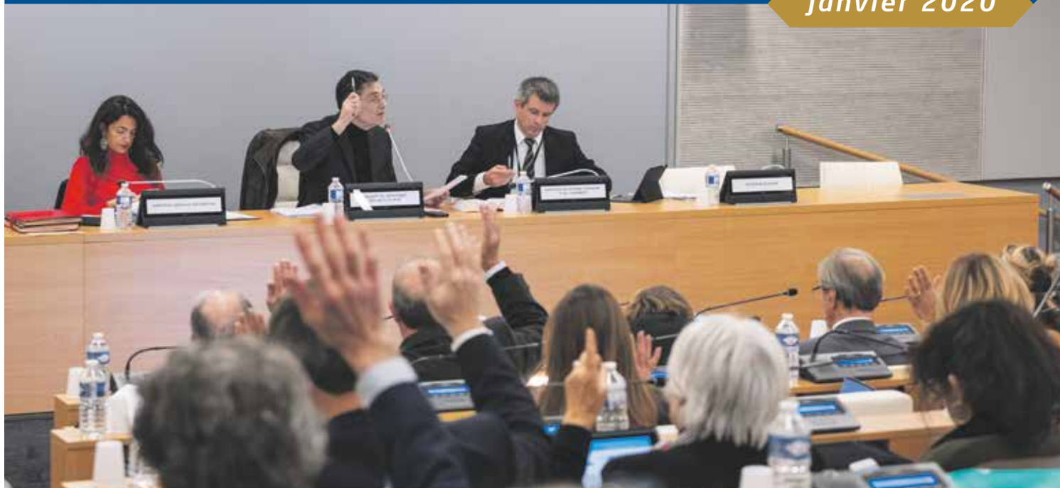
L'Assemblée départementale a adopté son budget pour 2020, le 13 décembre.