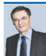
Patrick Devedjian Président du Département des Hauts-de-Seine

Je vous souhaite une très bonne année 2020.