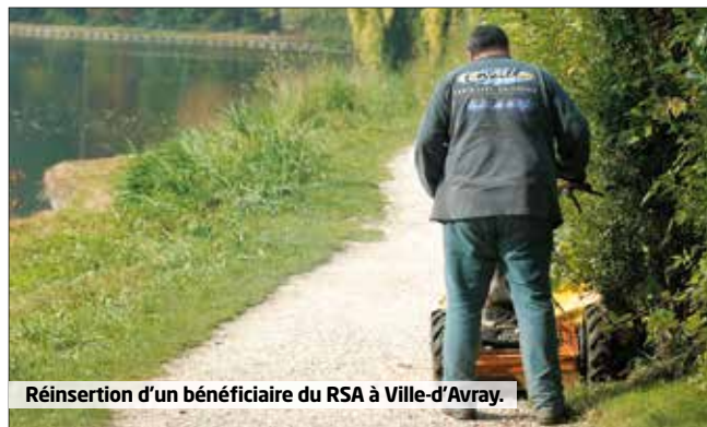
Réinsertion d'un bénéficiaire du RSA à Ville-d'Avray.

Il devra être retourné par voie postale avant le 29 juin au Département des Hauts de Seine - Pôle Solidarités - Direction de l'Insertion, de l'Emploi et des Actions sociales - Service Insertion et Emploi - 92731 Nanterre Cedex.