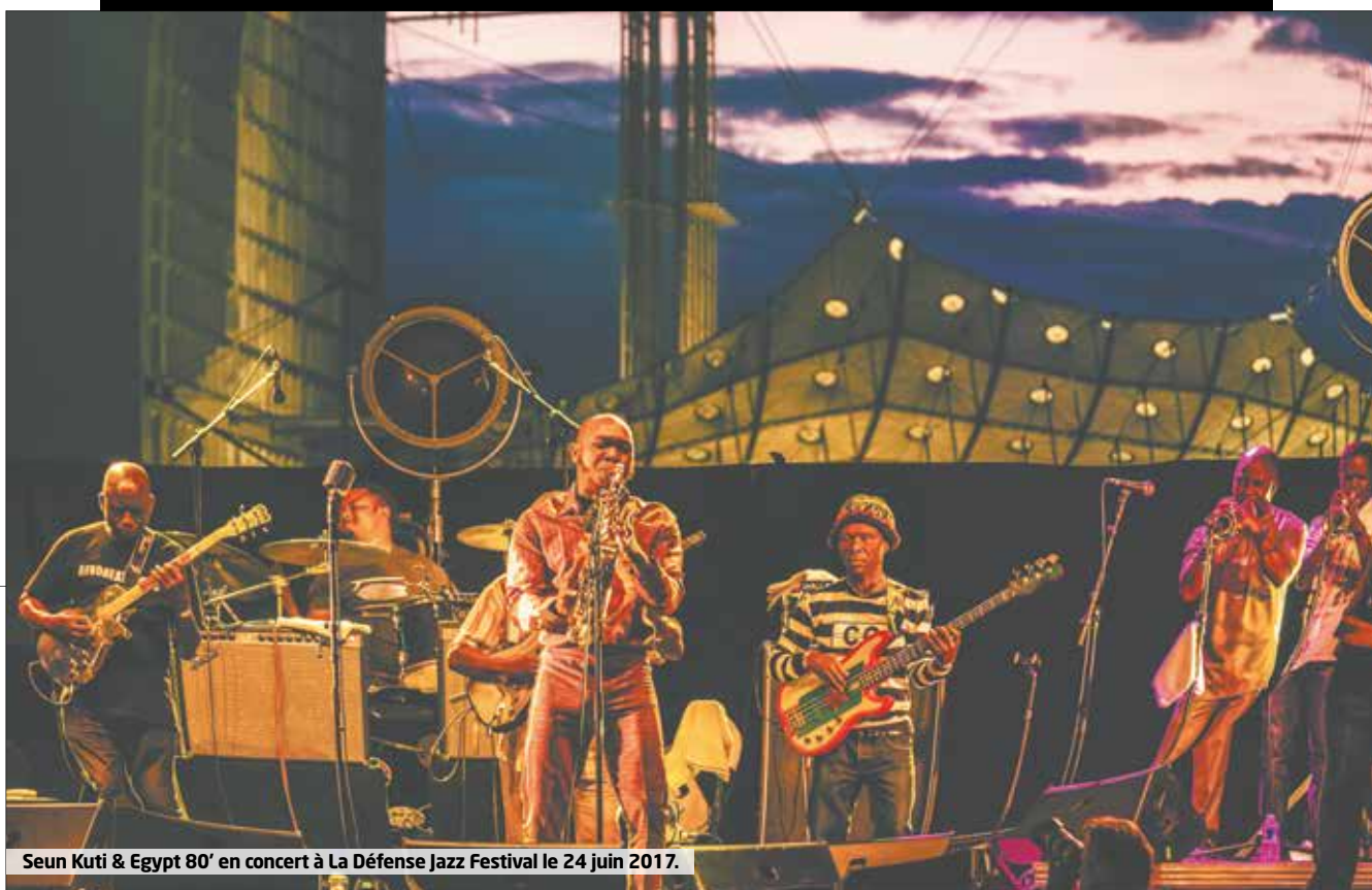
Seun Kuti & Egypt 80' en concert à La Défense Jazz Festival le 24 juin 2017.