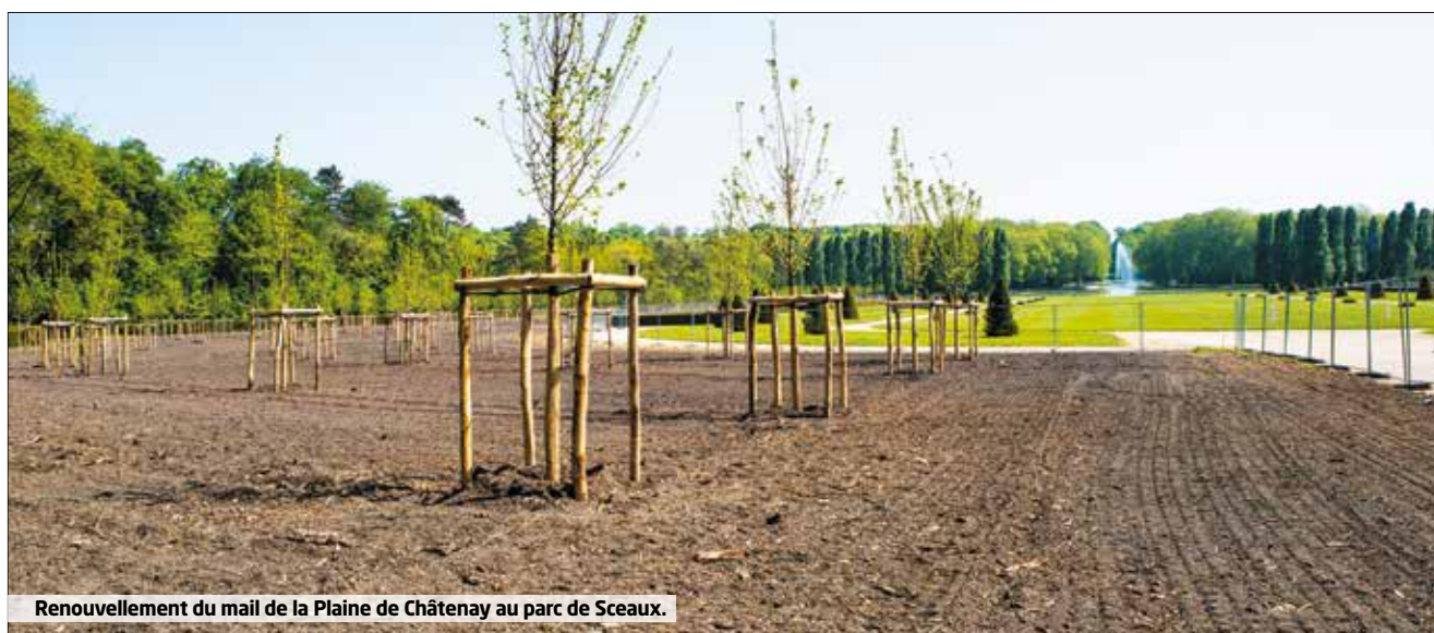
Renouvellement du mail de la Plaine de Châtenay au parc de Sceaux.

> RD72 : de la rue de l'Égalité et de la rue Tolstoï à la rue Rabelais. Réhabilitation du réseau d'assainissement non visitable départemental. Les travaux se termineront en septembre.