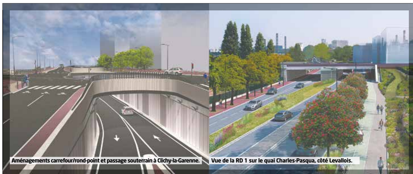
Aménagements carrefour/rond-point et passage souterrain à Clichy-la-Garenne.